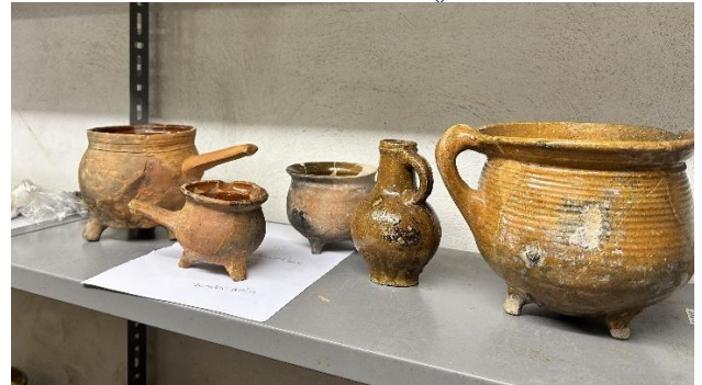
Afb. De vondsten zijn nu opgeslagen in de kelder van Markt 8.

In 2025 zijn er contacten gelegd met Saxion en de Omgevingsdienst Achterhoek (ODA). Uitkomst van deze contacten is dat een student van Saxion studierichting archeologie onder begeleiding van een medewerker van ODA met ingang van januari 2026 haar afstudeeronderzoek gaat richten op de Bredevoortse vondsten. Het onderzoek omvat het in kaart brengen van een deel van de vondsten en een advies uitbrengen hoe deze publiekstoegankelijk kunnen worden gemaakt.