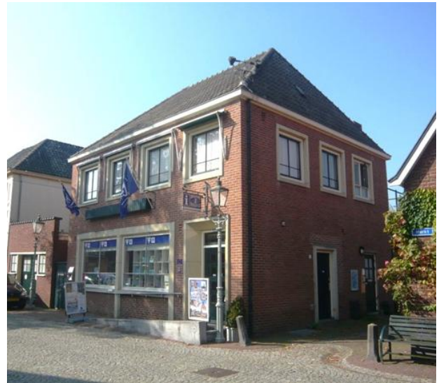
Afb.: Het pand op Markt 8 / Muizenstraat 3

De vereniging is eigenaar van het pand Markt 8 / Muizenstraat 3. De bovenverdieping is verhuurd in het kader van sociale huur. De benedenverdieping is grotendeels verhuurd aan de VVV en daarnaast is een kleine ruimte verhuurd aan Post NL. Vanuit hier sorteren de postbestellers de post voor Bredevoort.